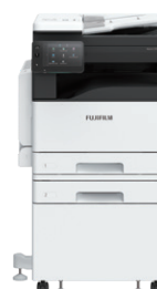
Với Mô-đun khay và Tủ