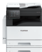
Với Mô-đun khay