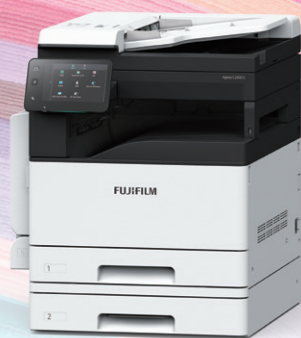
Apeos C2450 S với Mô-đun khay tùy chọn