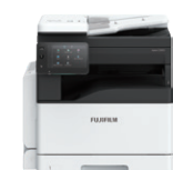
Mẫu tiêu chuẩn

Tùy chọn: Chức năng fax / Mô-đun khay / Tủ